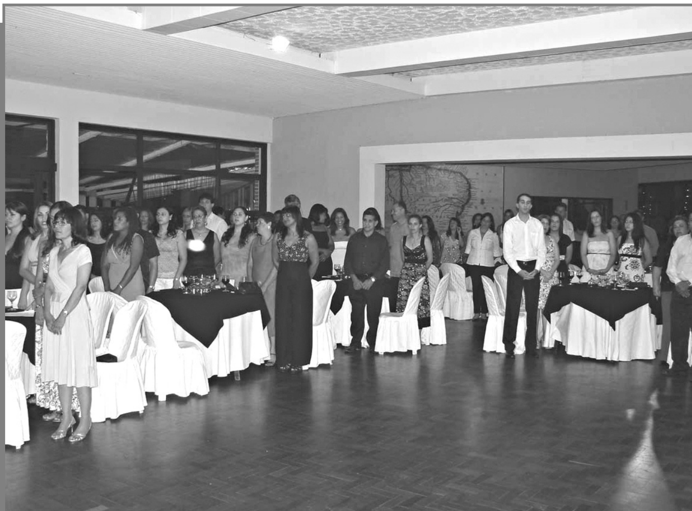
Em sua primeira turma, 49 educadores participaram do Programa Letra e Vida

A edição número 07 da Imprensa Oficial do município de Mairiporã, circulou na última semana com a seguinte descrição de data: Mairiporã, terça-feira, 20 de dezembro de 2006 , quando o correto seria: Mairiporã, terça-feira, 19 de dezembro de 2006 .