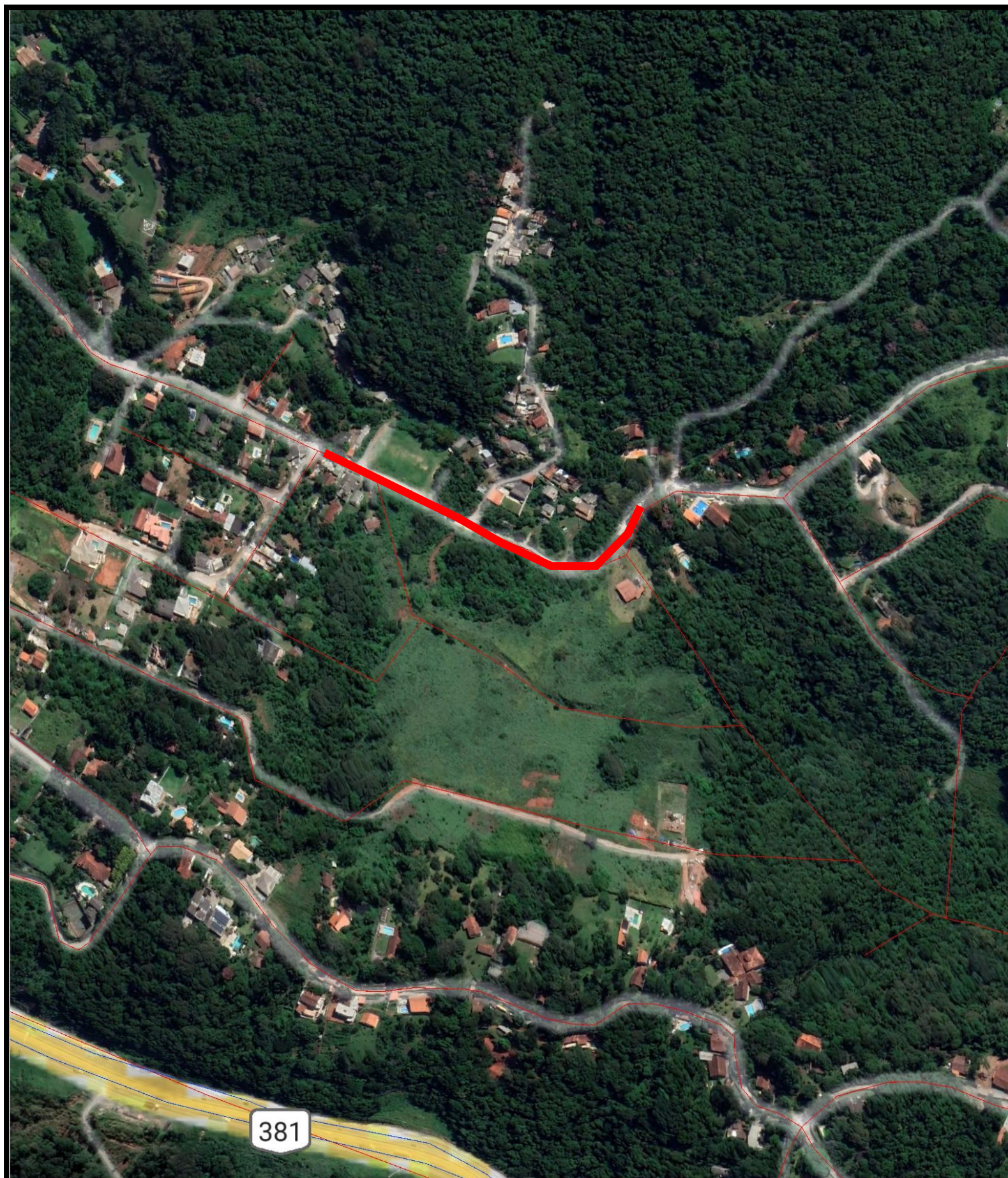
MAPA DE LOCALIZAÇÃO sem escala

COORDENADAS GEOGRÁFICAS: LATITUDE: 23°20'31.54"S LONGITUDE: 46°33'34.56"O