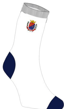
ILUSTRAÇÃO DO PRODUTO