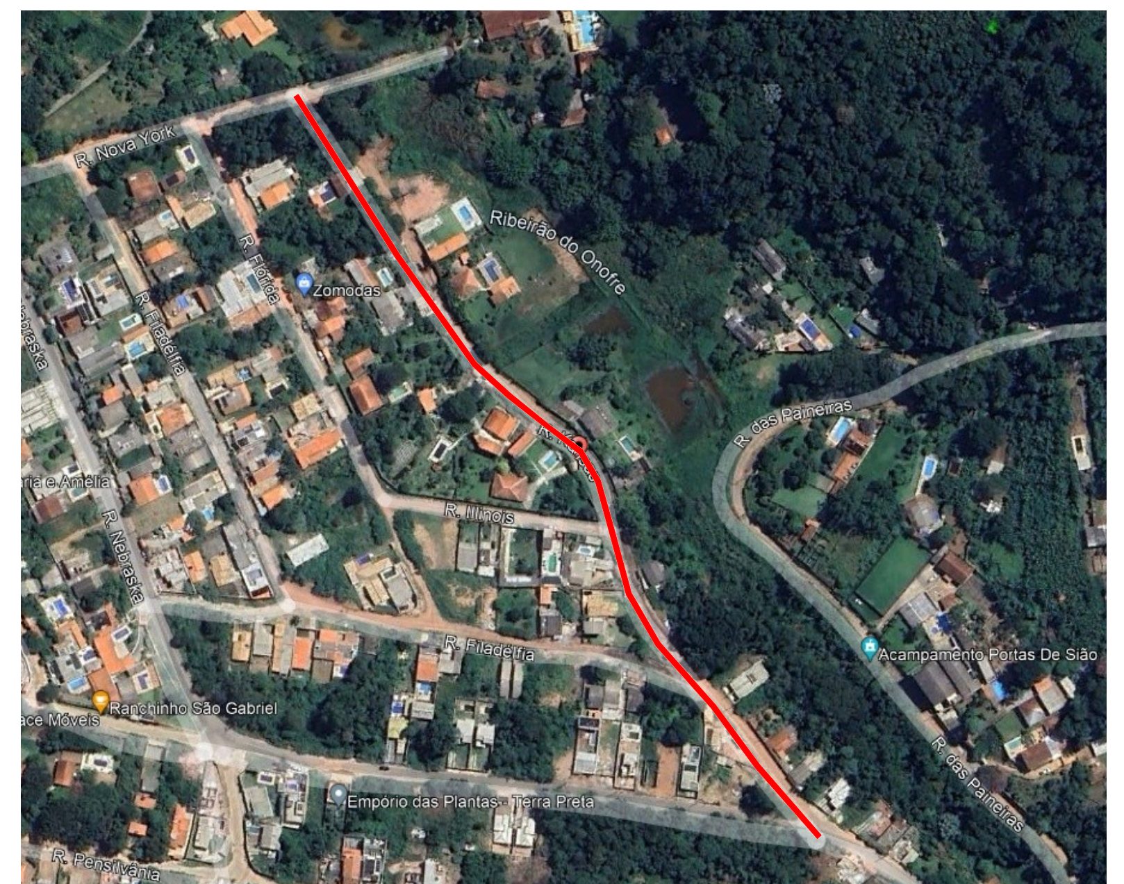
MAPA DE LOCALIZAÇÃO - S/E

COORDENADAS GEODÉSICAS: INÍCIO= ZONA: 23 K / LAT UTM: 7428508,68 m S / LONG UTM: 340116,18 m E FINAL= ZONA: 23 K / LAT UTM: 7428185,11 m S / LONG UTM: 340366,40 m E