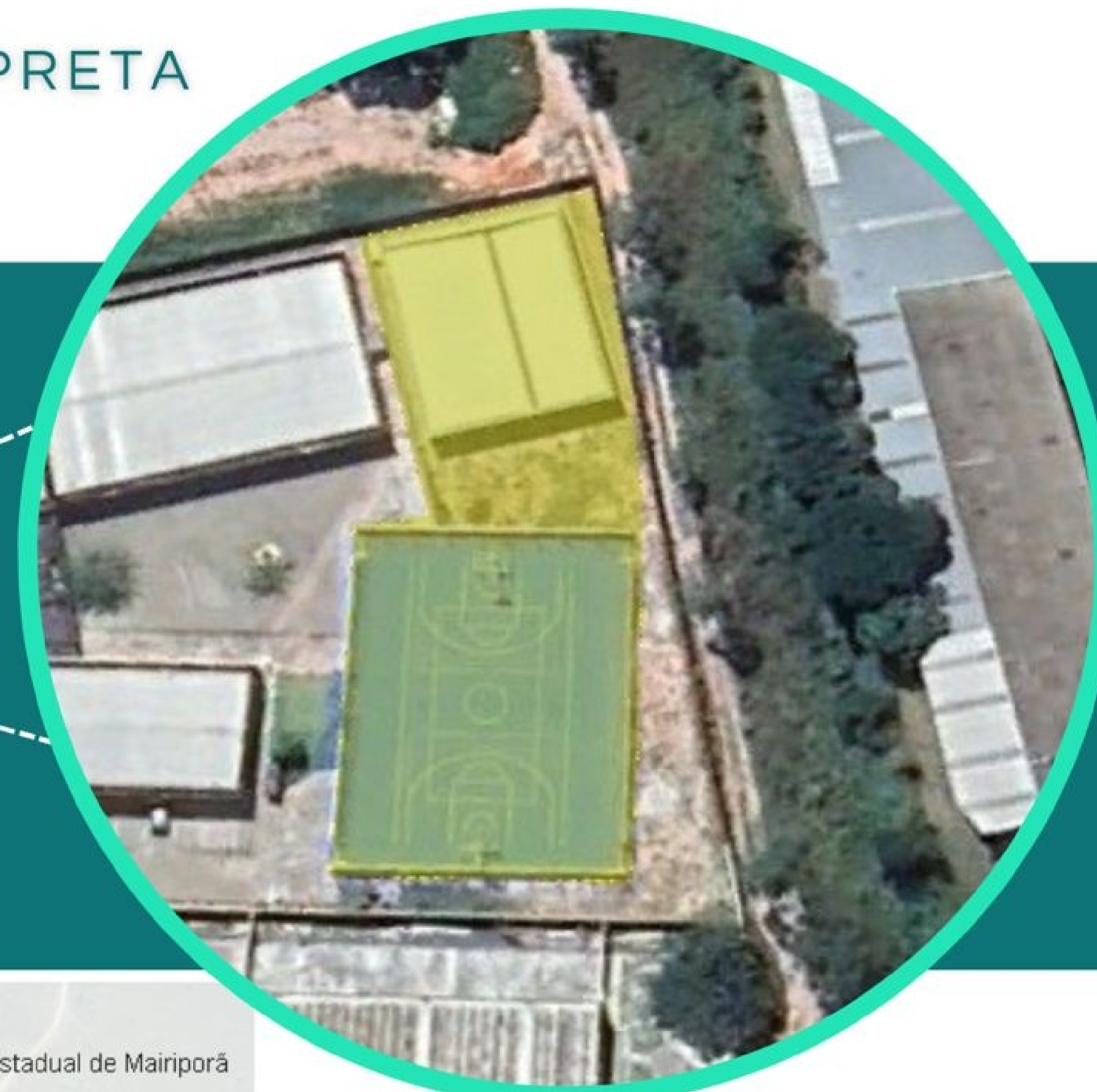
ÁREA COM INTERVENÇÃO