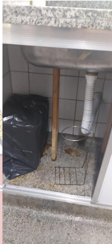
Foto 6 - Cozinha