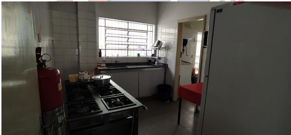
Foto 7 - Cozinha