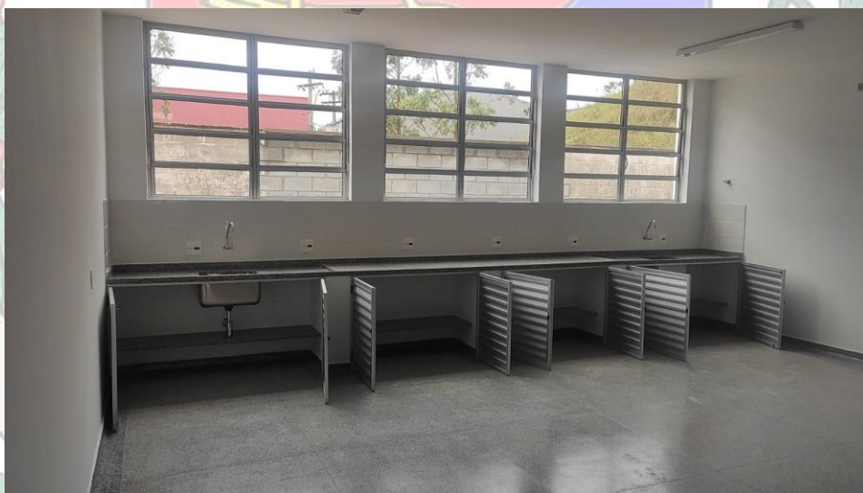
IMAGEM 10 - O laboratório está com todos os pontos de elétrica prontos e tem duas pias com torneira.

Alameda Tibiriçá, 535, Centro, Mairiporã – SP