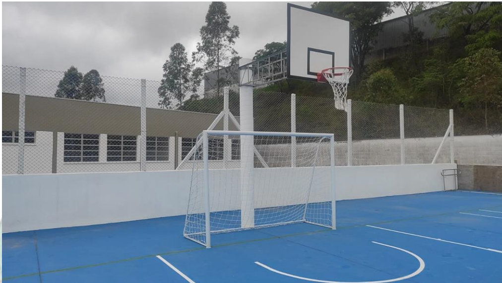
IMAGEM 11 - A quadra conta com todos os acessórios: traves, redes, cesta de basquete, demarcações e gradil em volta. Faltando somente a iluminação.