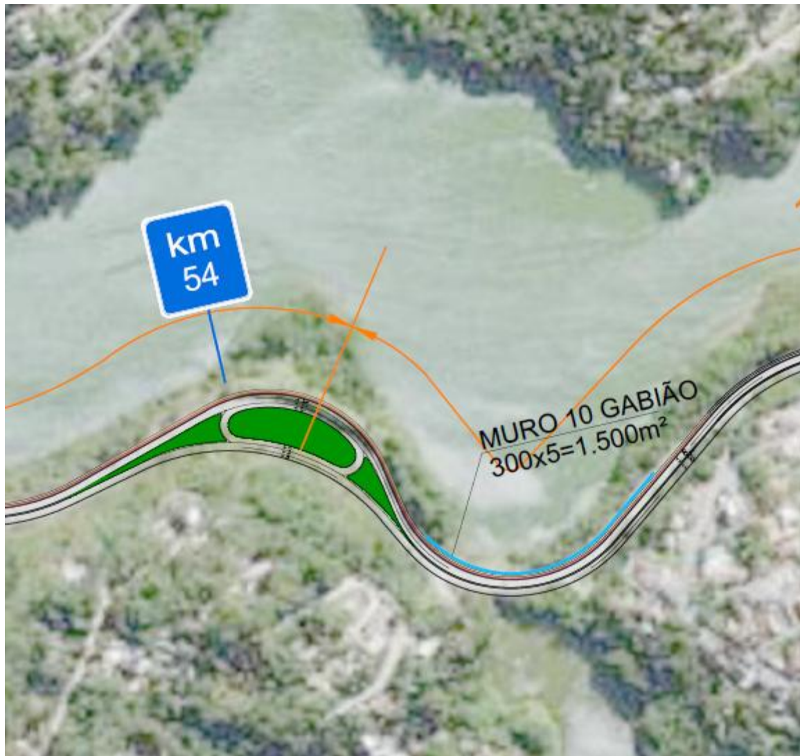
Aproximação do objeto – Rotatória Recanto do Lago Rod. Pref. Luiz Salomão Chamma – km54