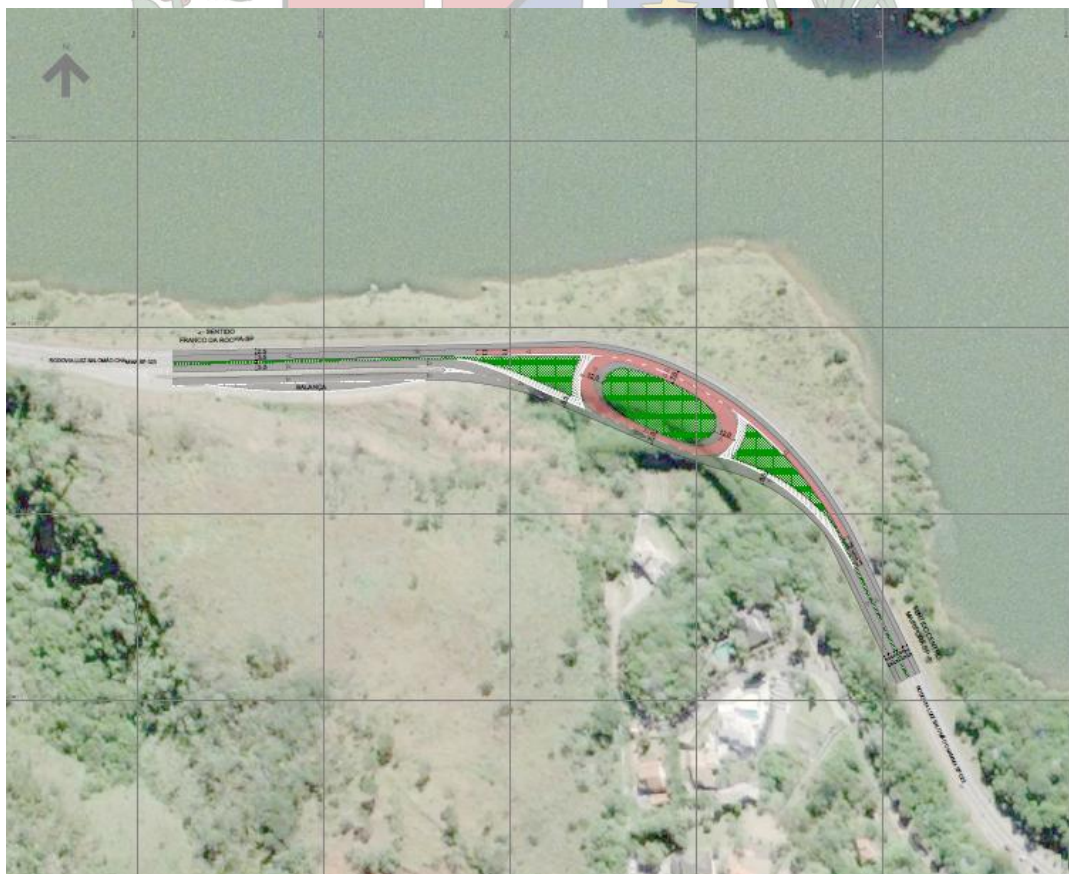
Aproximação do objeto – Rotatória Alpes Rod. Pref. Luiz Salomão Chamma – km53