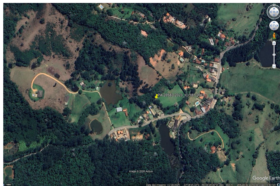
Coordenadas 23°18'27.69"S, 46°26'21.94"O – Estrada Municipal Mario Romeiro, altura do número 140, Sabão, Mairiporã-SP.